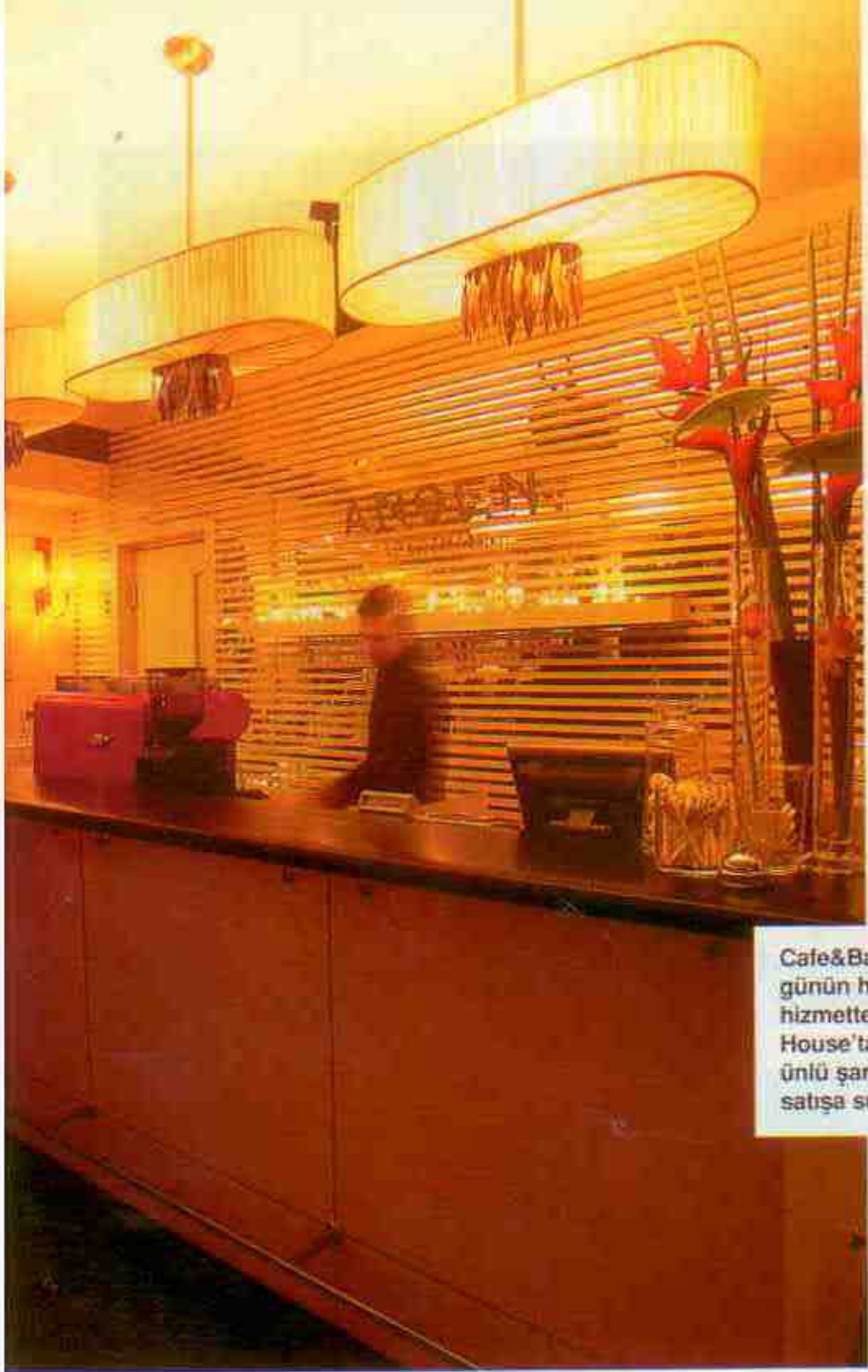
Cafe&Bar 130, günün her saati hizmette. Wine House'ta dünyaca ünlü şaraplar satışa sunulmakta.