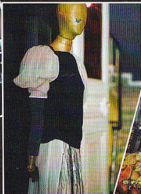
Turkiskt mode av Ümit Ünal.